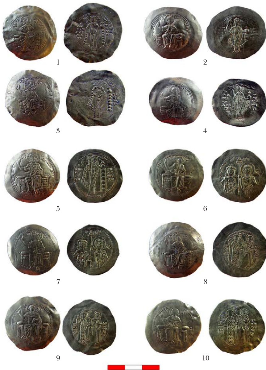
Обр. 1 – 5. Хиперпирони на Алексий I Комнин (1092 – 1118) Fig. 1 – 5. Hyperperones of Alexius I Comnenus (1092 – 1118)