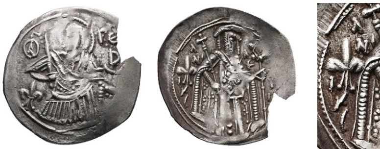
Обр. 2. Сребърна скифатна монета на Андроник II, тип II

Монетата е частично отчупена. Диаметърът е 22,4 мм, а теглото – 1,2 г (обр. 2).