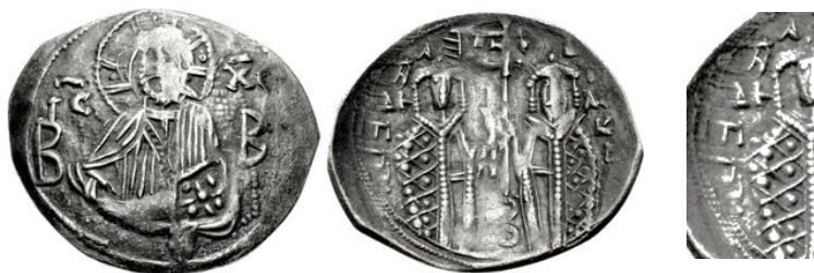
Обр. 4. Сребърна трахея на Михаил VIII Палеолог с Андроник II

букви една над друга, а отдолу буквите ΔЄС. Реверсът е запълнен с образ на Христос Пантократор, украсен с две букви В – В (обр. 4).