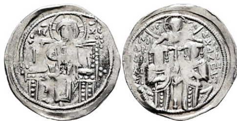
Обр. 5. Реформена плоска сребърна монета с диаметър 24 мм, тегло 2,00 г, сечена през 1294 г. по повод коронацията на Михаил IX като съимператор на Андроник II

ни сръбски динари – имитации на венецианския грош, още при Стефан Драгутин (1276 – 1282)? Не трябва да убягва от вниманието и отсичането на първите български сребърни монети във времето на Георги I Тертер (1280 – 1292) и то в началните години на неговото управление, когато българската църква му е отказвала церемонията по интронизация и миропомазване за цар. Взети в съвкупност, всички тези фактори са индикация за обективна икономическа и политическа потребност от въвеждането на нов сребърен паричен номинал във Византия още в началните години на управлението на Андроник.